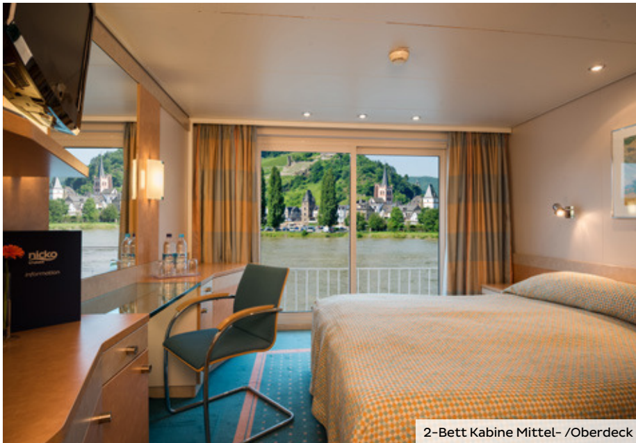
2-Bett Kabine Mittel- /Oberdeck

Die Bordwährung ist Euro. Sie können am Ende der Kreuzfahrt Ihre Rechnung sowie an Bord gebuchte Ausflüge bequem bar, mit Ihrer EC-Karte (PIN-Nummer erforderlich) oder mit Ihrer Kreditkarte (Mastercard, VISA) bezahlen.