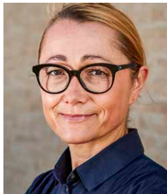
Tanja Grandits , Stucki in Basel: 2 Michelin-Sterne, 18 Punkte im Gault Millau, Bester Schweizer Koch Gault Millau 2014.