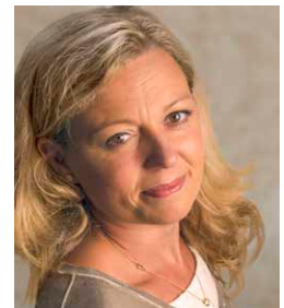
Natalie Lumpp , Star-Sommelière und Deutschlands führende Wein-Expertin.