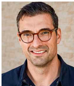
Hubertus Tzschirner , esskunst Hubertus Tzschirner, Dozent, Caterer, erfolgreicher Buchautor: Sous Vide (2013), Fingerfood deluxe (2014), ROH! (2015), Burger unser (2016).